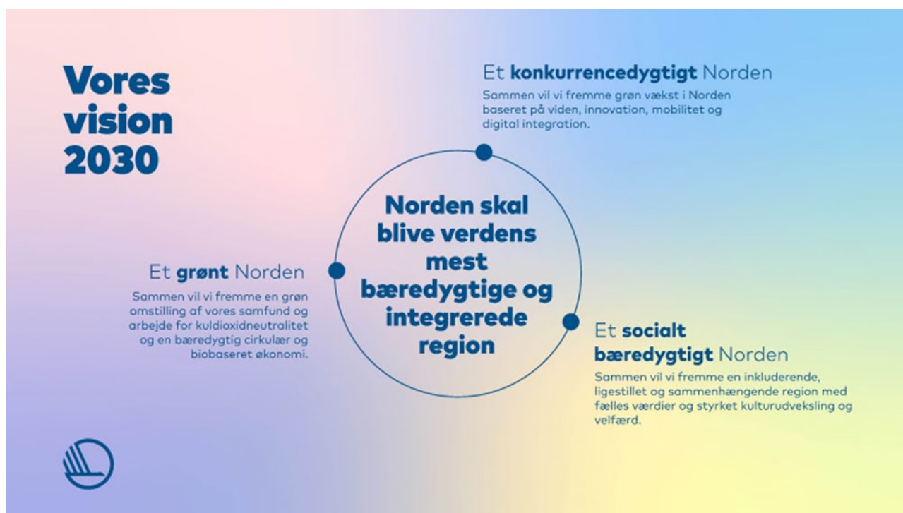
Bild 1: NMR vision 2030. Handlingsplanen består av 12 olika visioner indelade i de tre sektorer, Norden som världens mest hållbara och integrerade region.

I det nya nordiska regionalpolitiska samarbetsprogrammet för regional utveckling och planläggning för 2021–2024 slår Nordiska ministerrådet (NMR) mål för är ett grönt, konkurrenskraftigt och socialt bärkraftigt Norden. Finland står för ordförandeskapet år 2021.